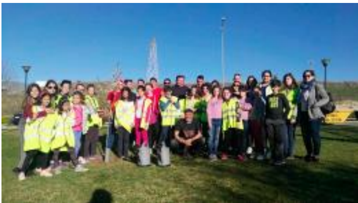
Actividades del día del Árbol.