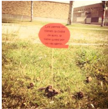
Campaña "Villamayor sin cacas"