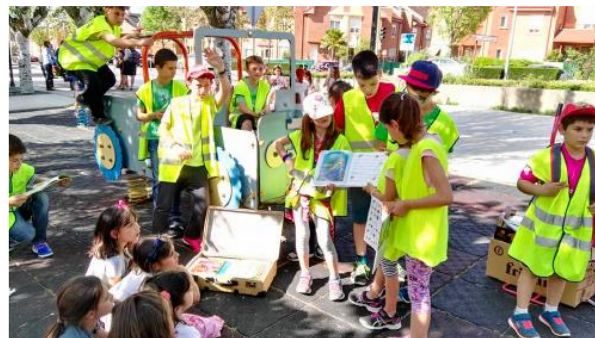
Iniciativa "La maleta viajera".