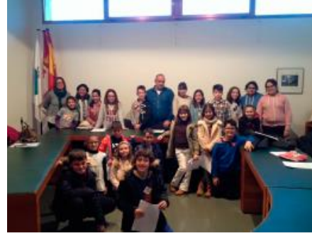
Celebraciones de los Consejos de Ciudad de l@s Niñ@s.