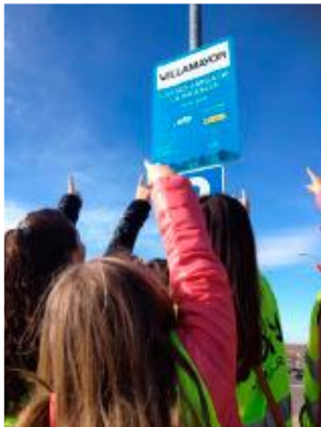
Renovación de la certificación de UNICEF de Ciudad amiga de la infancia.