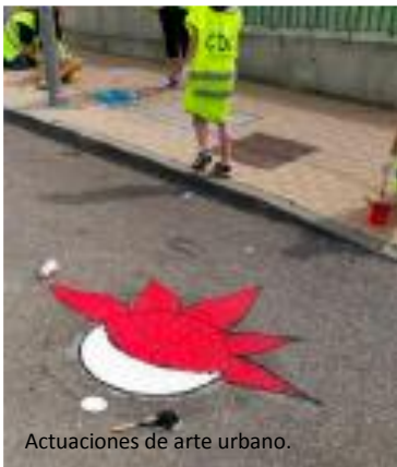
Actuaciones de arte urbano.